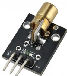
Figura 1: módulo laser 5mW.

Veja a seguir o módulo que iremos utilizar.